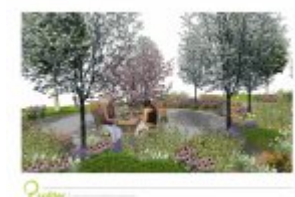
Architektura krajobrazu - wizualizacja 3