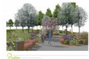
Architektura krajobrazu - wizualizacja 2