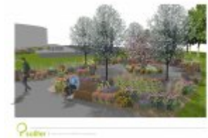
Architektura krajobrazu - wizualizacja 1

Ogłoszenie nr 504025-N-2019 z dnia 2019-01-16 r.