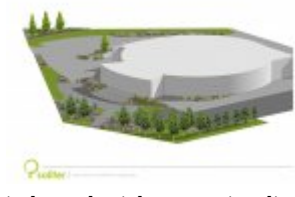
Architektura krajobrazu - wizualizacja 4

Należy podać minimalny procentowy wskaźnik